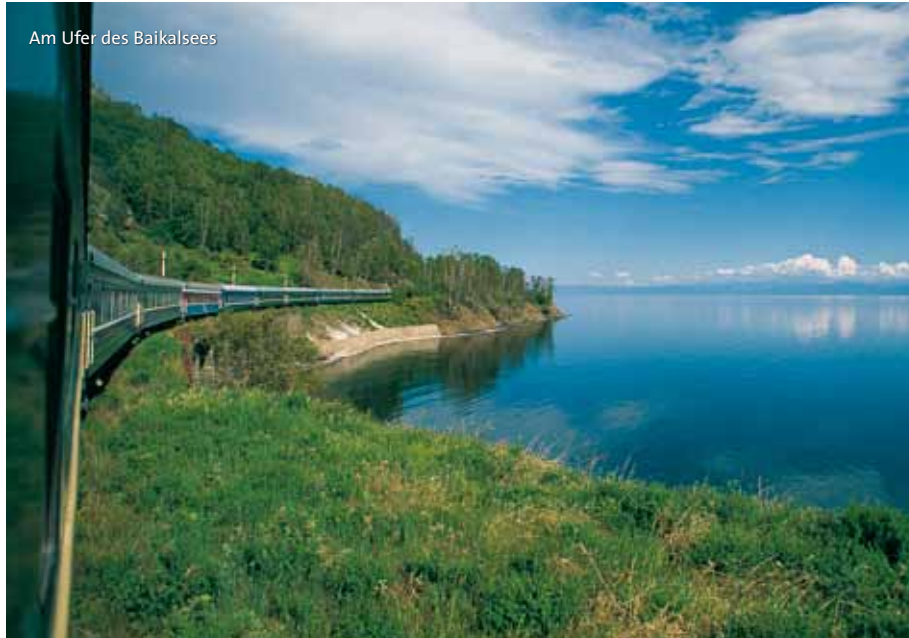
Am Ufer des Baikalsees