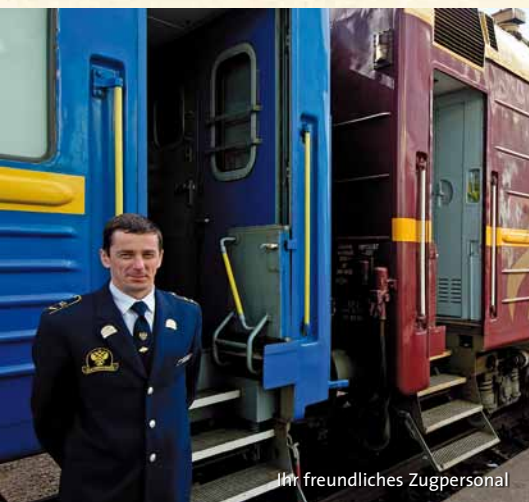
Ihr freundliches Zugpersonal

Der heutige Tag ist ganz dem Naturwunder Baikalsee gewidmet, dem größten Süßwasserreservoir der Erde. Vormittags fährt Ihr Sonderzug auf der alten Trasse direkt am See entlang. Der