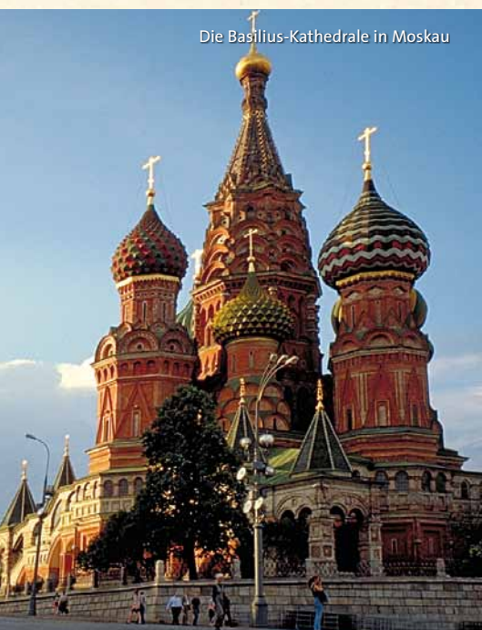
Die Basilius-Kathedrale in Moskau

Bitte haben Sie Verständnis dafür, dass wegen der aufwändigen Logistik dieser Reise Änderungen leider vorbehalten sind.