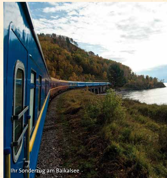
Ihr Sonderzug am Baikalsee

Über Jahrhunderte waren die Türen des ehemaligen Kaiserpalastes, der Verbotenen Stadt, dem Volk verschlossen. Heute aber dürfen Sie einen Vormittag lang die prächtigen Hallen und geheimnisvollen Tempel bestaunen. Und abends geht es zum ersten Mal auf die