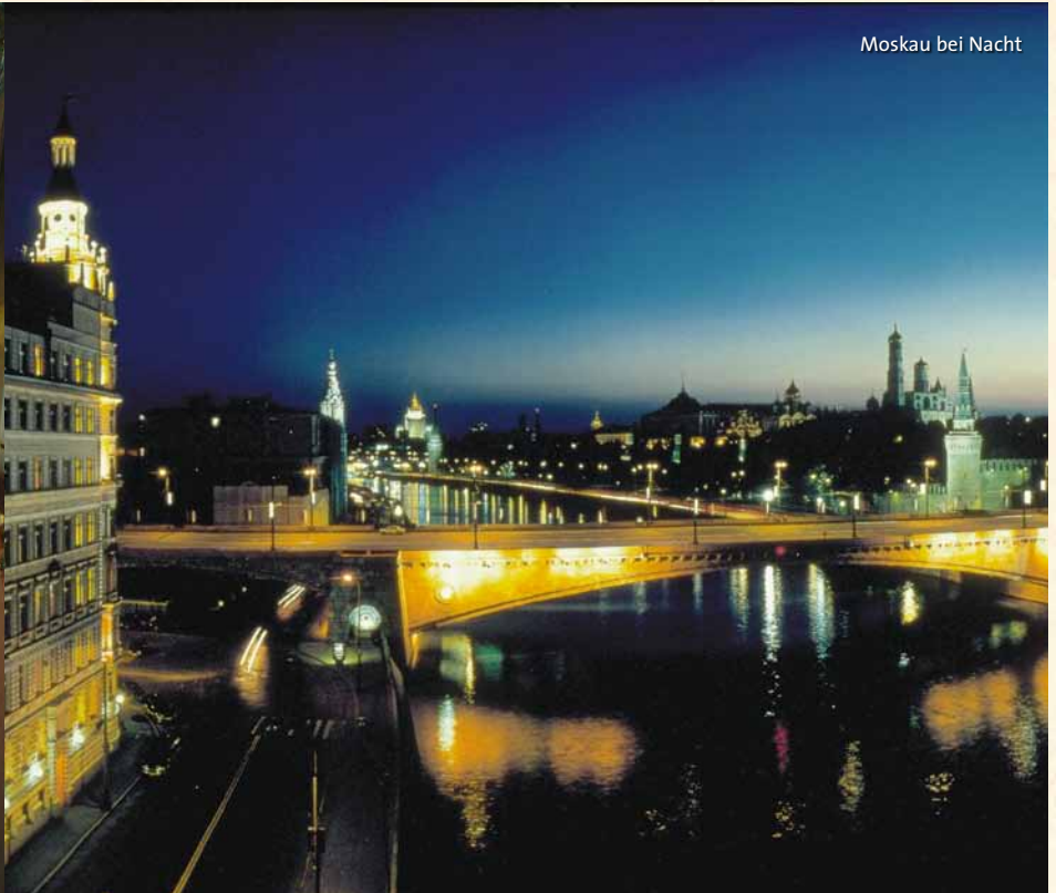
Moskau bei Nacht

nehmen Sie im Speisewagen Abschied von der freundlichen Sonderzugbesatzung, die noch einmal ihr Bestes gibt. (FA)