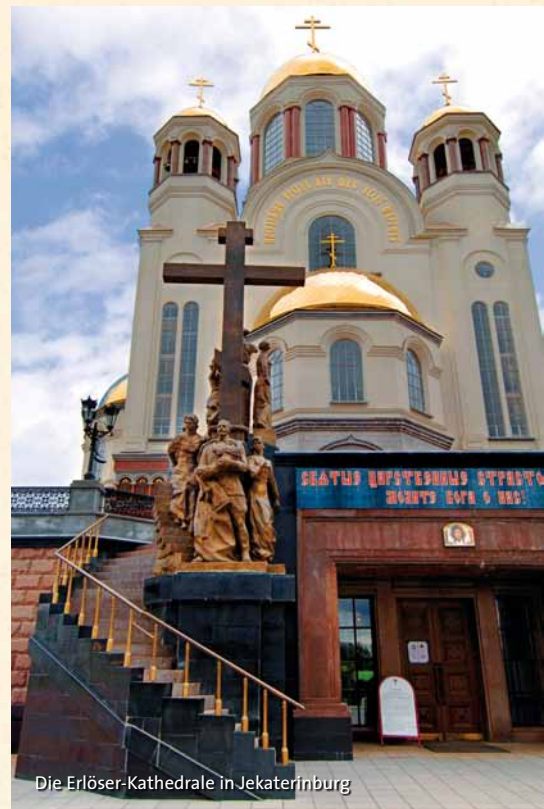
Die Erlöser-Kathedrale in Jekaterinburg

Nachmittags haben Sie einen kurzen Aufenthalt in Jekaterinburg, der Hauptstadt des Ural. Diese Stadt ist als der Ort bekannt, an dem die Familie des russischen Zaren Nikolaus II. im Jahre 1918 ermordet wurde. Während einer kurzen Stadtfahrt sehen Sie die neu errichtete Erlöser-Kathedrale auf dem Blut, die an dieses Ereignis erinnert und das im Jahr 2009 sehr ansprechend restaurierte Stadtzentrum. Zurück an Bord