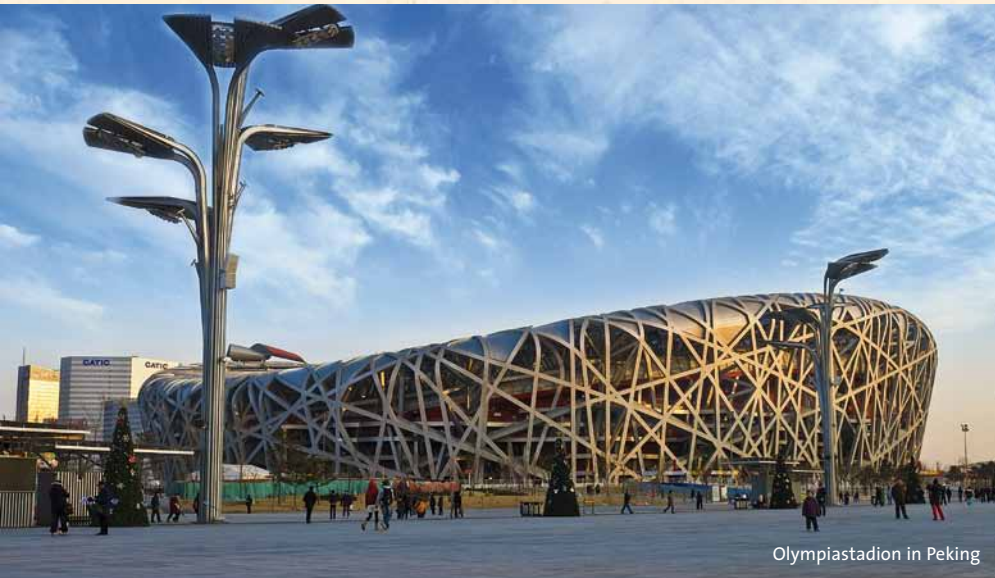
Olympiastadion in Peking